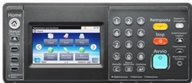
300ci: 4,3 pollici (10,9 cm)

PIU' INTUITIVITA'. Display grande ed intuitivo: