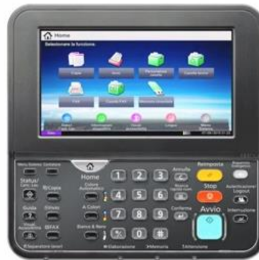
350ci / 400ci: 7 pollici (17,8 cm)